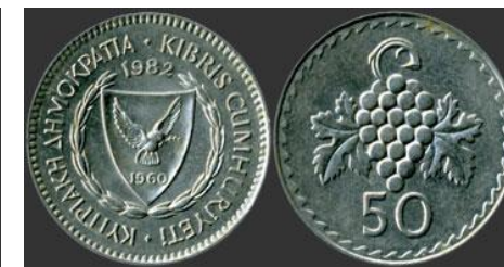
Μετά την ανεξαρτησία