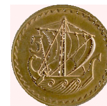
Αγγλοκρατίας Μετά την ανεξαρτησία