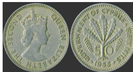
Κυπριακά Σελίνια: Αγγλοκρατίας